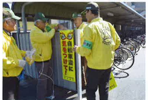
盗難防止の看板設置

校の駐輪場に「自転車盗防止」啓発用の立看板を設置したり、通学時間帯に広報活動を推進しました。