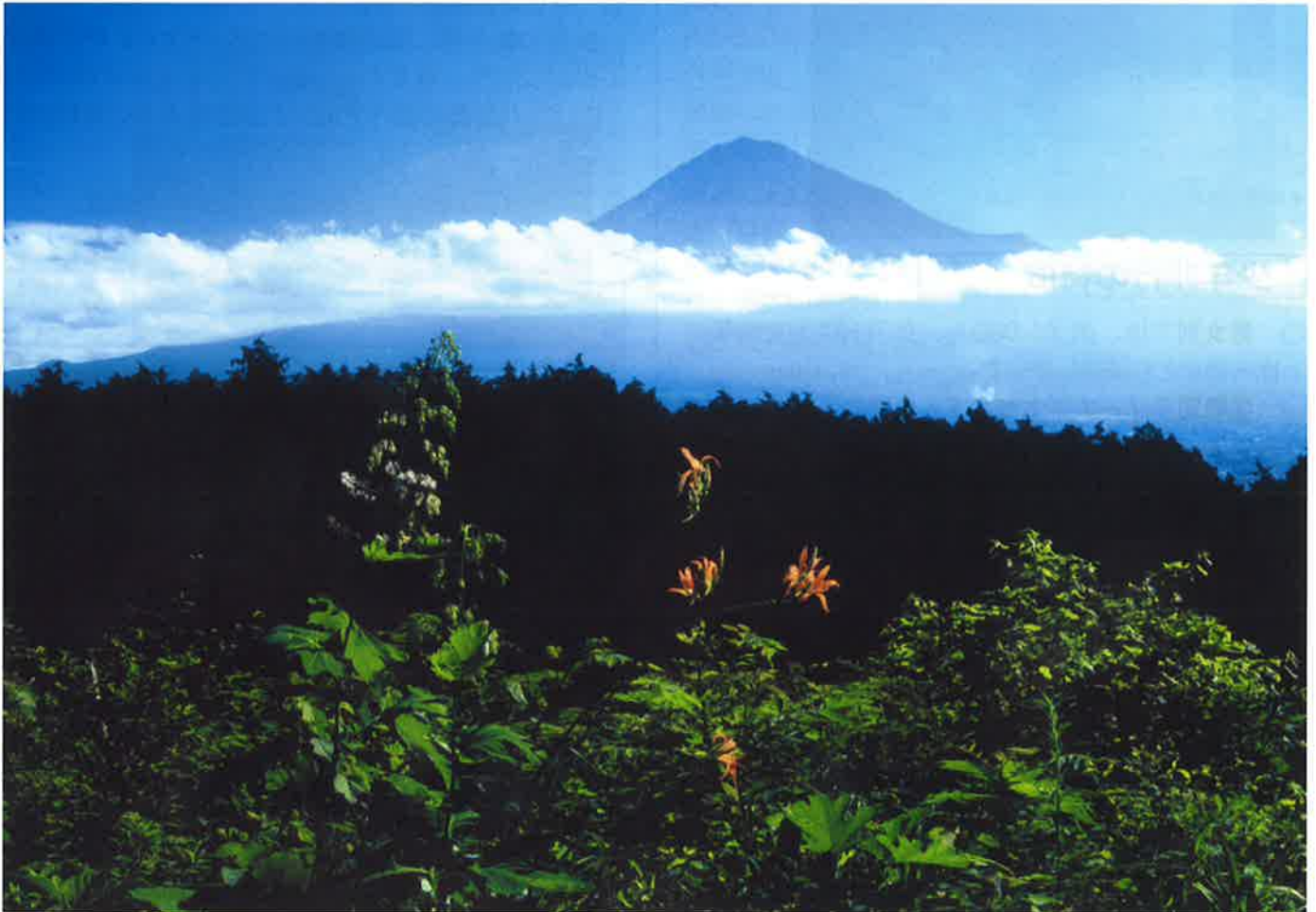
「盛夏の芙蓉峰」 富士宮市大中里から