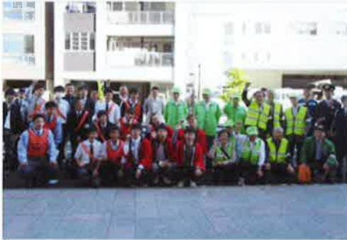
ハイスクール防犯隊と

続けていた だいてい る方もお られ、管 内の地域 安 全 推 進員は現 在137名