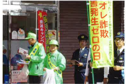
振り込め詐欺撲滅キャンペーン

日々変化していく犯罪の中で終結のない活動でありますが、警察官、行政担当者、学校等と連携を取りつつ「安全・安心な街づくりは自分たちの活動から」を念頭に今後も防犯活動に従事していきたいと思ひます。