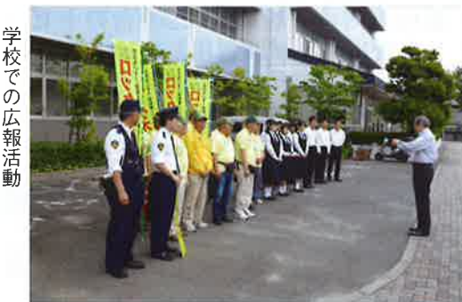
学校での広報活動

時間いっぱいに登校し、慌てて鍵を掛け忘れるケースが多いと思ひますが、自転車を止めたら必ずロック