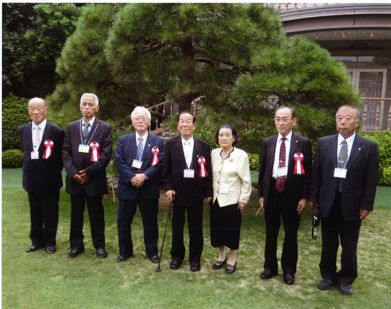
東京「明治記念館」で表彰された皆さま