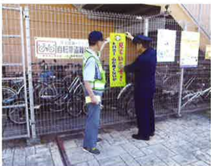
自転車盗難防止キャンペーン

藤枝市は静岡県内でも人口が増加傾向にありますが、犯罪件数は毎年減少にあり、10年前の半分に推移しています。