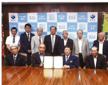
自治会への協力依頼

しかし、清水区内の特殊詐欺被害は、今年9月末現在、28件・約7,000万円を認知し、さらに「サギ電話」による相談は約300件と、被害もサギ電話件数も県内ワースト1という危機的状況であり、今まさに「清水区が狙われている」のです。