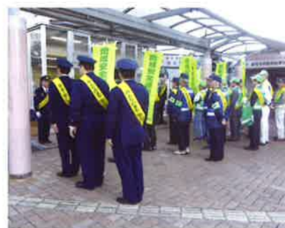
地域安全運動キャンペーン開始式

市民に見せる防犯活動(徒歩での危険箇所の巡回等)を活かして、今後も継続して安全安心の街を目指します。