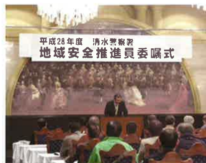
地域安全推進員委嘱式

私たち地域安全協議会も清水の防犯リーダーとして、警察や自治会と更に連携して、各種犯罪被害防止活動を積極的に推進し、現在の清水区の状況を「ピンチはチャンス」と前向きに捉え、「安全で安心できる清水のまち」のため、これからも一生懸命活動していきます。