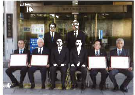
県警察本部長に受賞報告