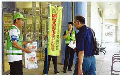
振り込め詐欺被害防止広報

今後も警察・行政と連携を密にして、地域に密着した防犯活動を推進し、市民に防犯に対する取り組みの重要性を高めたいと思います。