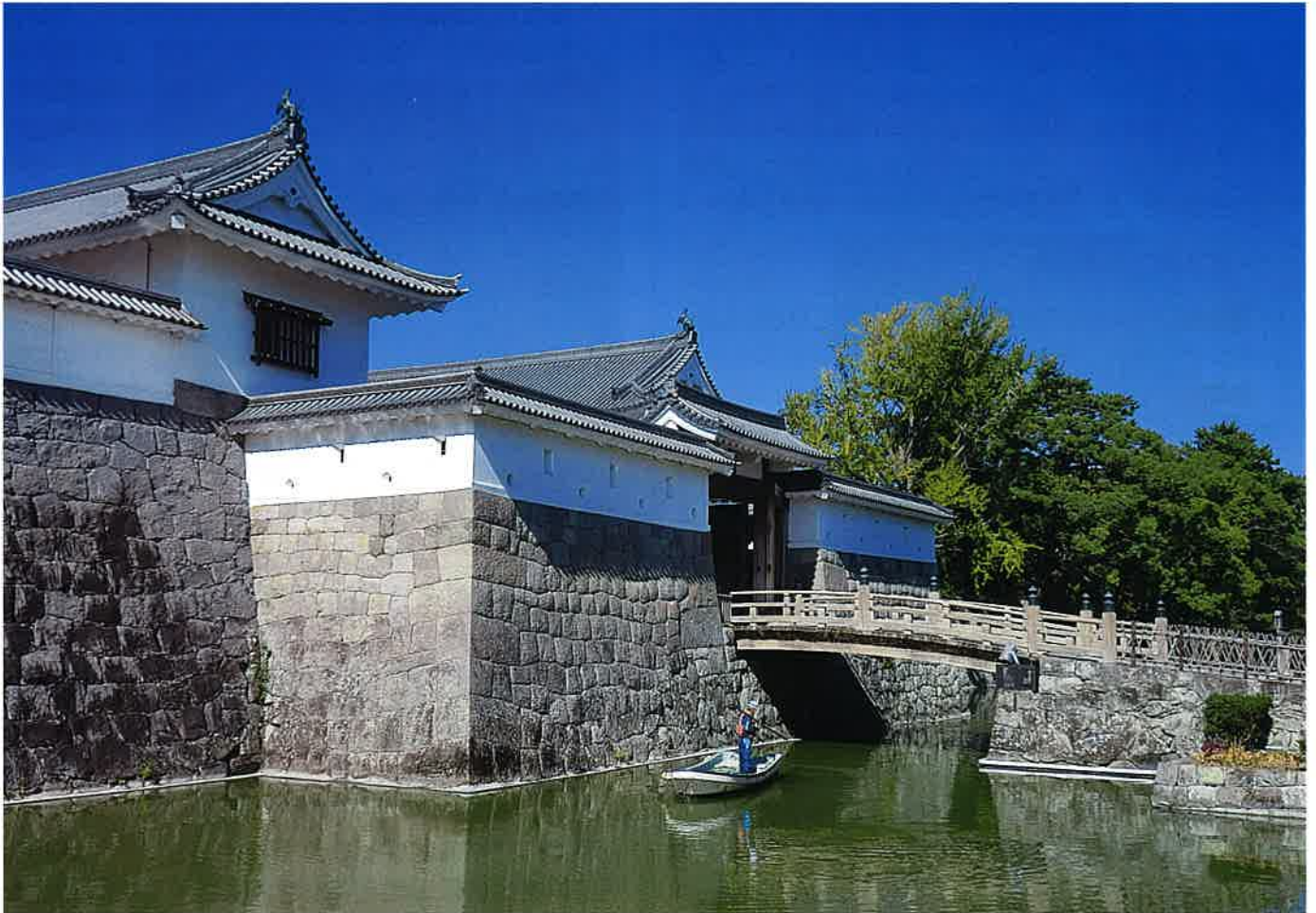
駿府城公園「東御門」