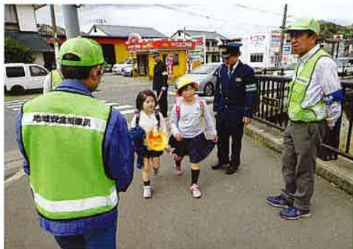
子ども見守りパトロール

少人数では活動に限りがあるため、交番・駐在所の枠にとられず、隣接する地区で連携をとりながら