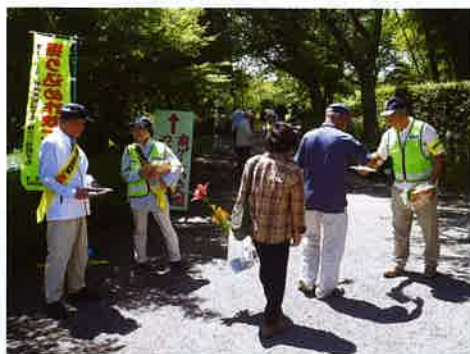
街頭での防犯広報

森町でも袋井市同様、児童の登下校時の挨拶運動にあわせ、児童が犯罪や交通事故にあわないよう、地域に密着した見守り活動を実施しています。