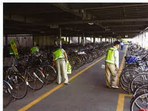
自転車盗難防止の広報

そんな状況を踏まえ、袋井市、森町ともに犯罪のない安全安心な暮らしを目指し、多くの住民の防犯意識の向上にもつながるよう、地域ぐるみで犯罪抑止に取り組んでいきます。