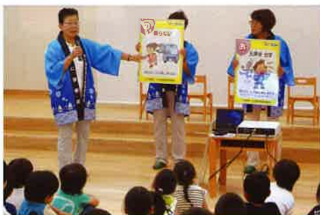
「なかいず子ども園での防犯教室」

地域安全推進員の女性部は「大仁防犯レディス」として平成22年にスタートしました。活動開始時から続けている、手作り啓発品の作成は、女性ならではの視点を活かし「身近で安価な材料でアピール」をモットーに、毎年思考を凝らした啓