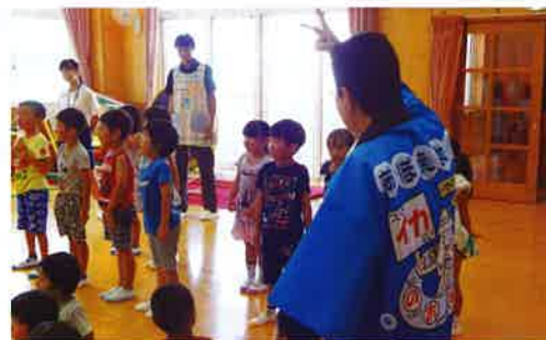
「土肥子ども園での防犯教室」

私たち女性部の最大の強みは相互の連帯感です。交番や駐在所の管内を越えて、お互い和気藹々となごやかに活動を行っています。今後も警察や地域の方と協力して安全で安心な地域社会を目指して息の長い活動を続けていきたいと思っています。