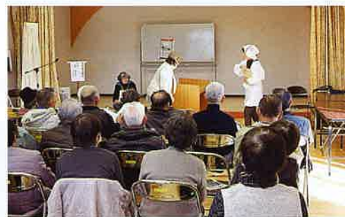
「オレオレ詐欺の寸劇」

ことを願って活動しています。女性部としては、老人会のいきいきサロン等でオレオレ詐欺の寸劇を実施しています。少人数の女性部ですのでなかなか思うような寸劇はできませんが、少し笑いを入れたりしてゆったりとした気持ちで見ただけのようにしています。終ってからたくさんの拍手をして頂き、大勢の高齢者に伝えていければ良いと思って活動しています。幼稚園においては子供達に自分の身を守る「イカノオスシ」を教えています。今後も警察、行政、地区の見守り隊と連携を密にして住民の防犯意識の向上に取り組みたいと思います。