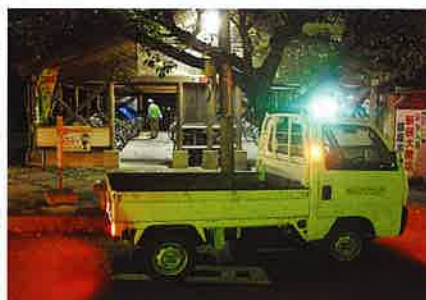
磐田市 高橋 道子