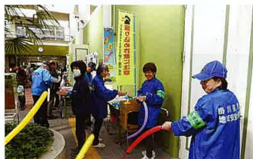
「振り込め詐欺被害防止のキャンペーン」

掛川警察署地域安全推進員は75人で活動しています。青色回転灯防犯パトロールは、各地区で子供の見守り、地域の見守りに活躍しています。銀行等でのオレオレ詐欺のパンフレット配りは、高齢者の方々に「気をつけなくっちゃいけないね」と言われると、もっと大勢の方々にお知らせしていかなければと思