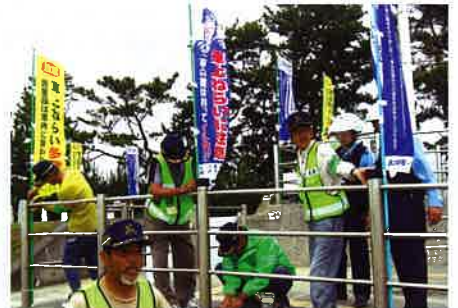
車上ねらい撲滅の『イルカ作戦』

犯罪のない安全で安心して暮らせるまちづくりは、わたしたち地域住民の共通の願いです。これからも実情に合った効果的な防犯活動を継続していきたいと思えます。