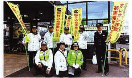
オレオレ詐欺被害発生ゼロの日活動

これからも地域の皆さんが安心して暮らせるまちづくりのための防犯活動を期待しています。