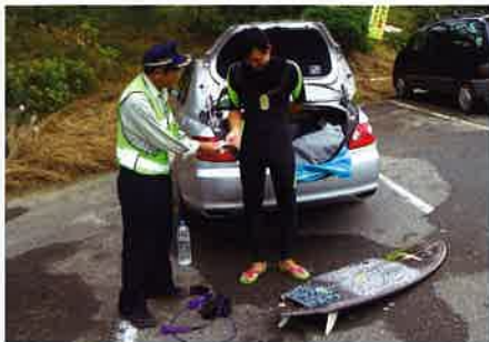
サーファーへのストラップ配布

当然、車上ねらいの被害は右肩上がりとなり、翌年『イルカ作戦』と銘打って車上ねらい撲滅を図りました。