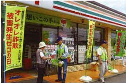
オレオレ詐欺被害発生ゼロの日キャンペーン

各地区祭典等においての各種犯罪防止広報活動や毎月15日の「オレオレ詐欺被害発生ゼロの日」に、金融機関やスーパー、コンビニエンスストア等の利用者に対し、振り込め詐欺被害にあわないよう広報紙や啓発品を配布し、注意を呼び掛けています。