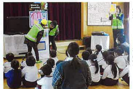
幼稚園での防犯教室

これらの活動を繰り返しながら、管内から少しでも犯罪が少なくなること、それが地域の安全安心に繋がることと考え、積極的な防犯活動を続けていきたいと思っております。