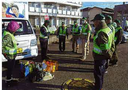
今から戸別訪問に出発