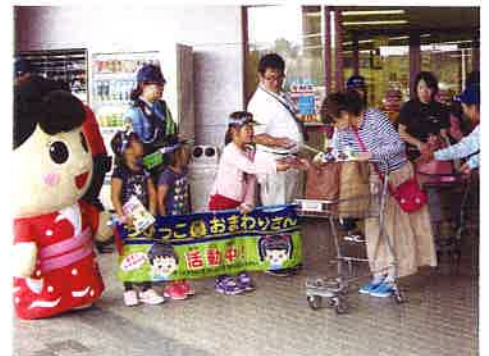
ちびっこおまわりさん活動中

この3つのお約束は、ちびっこおまわりさんが家庭でお父さん、お母さん、おじいちゃん、おばあちゃん、兄弟に防犯意識を広げていき、習慣にすることで、自分の身を守る能力を引き出して危険な状況からの確に対処できる子どもに育て、大人の防犯意識を高め、幼児が成長した後の長期的な視点でも犯罪被害や交通事故防止が期待できる活動です。「継続は力なり」の言葉を信じ、ちびっこおまわりさんの小さな力が大きな力となり、安全で安心して暮らせるまちづくり活動を継続していきます。