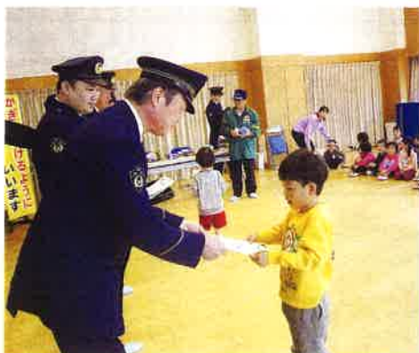
ちびっこおまわりさんの任命

今回は、平成26年度から始めた「ちびっこおまわりさん」の活動をご紹介します。管内全ての幼稚園・保育園の年長児童(約700人)を対象に、菊川警察署長が「ちびっこおまわりさん」に任命して、3つの約束をしています。