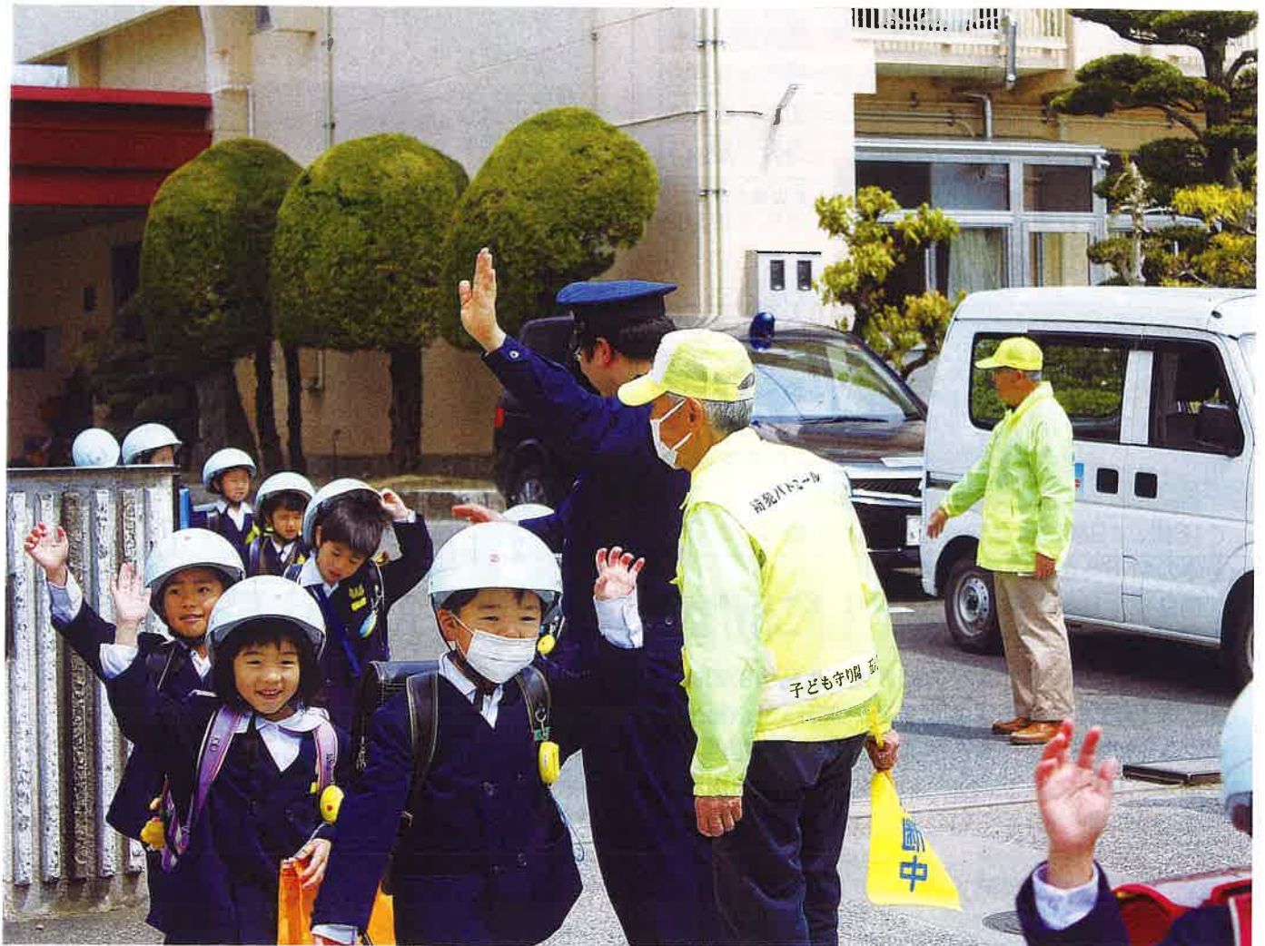
昨年の青パト写真コンクール最優秀賞