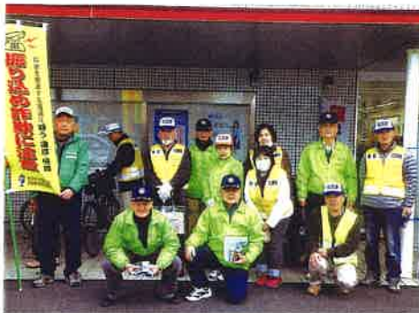
古庄地域防犯ボランティアのメンバー

校時の見守り⑤護国神社の祭事での防犯パトロールが主な活動です。中でも自転車盗難被害防止キャンペーンは、年2回、朝の通勤通学時間帯に、古庄交番管内