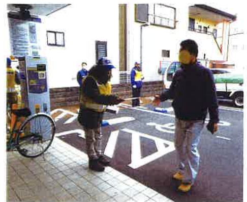
自転車盗難防止キャンペーン

校時の見守り⑤護国神社の祭事での防犯パトロールが主な活動です。中でも自転車盗難被害防止キャンペーンは、年2回、朝の通勤通学時間帯に、古庄交番管内