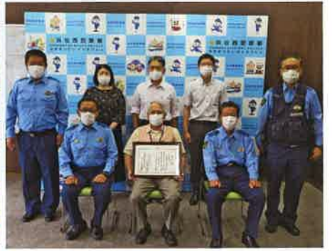
浜松西地区の受賞状況

子どもや女性に対する不審者による声かけ、つきまといなどの不審者情報や防犯対策情報をメールで送ります！