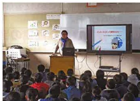
管内小学校で講演をする筆者

誤った判断をする子ども達が1人でも減る事を期待しながら、私達の活動も常に新しい知識を持って、それを正しく伝えていく事が大切なのだと、より一層のやりがいを感じているところであります。