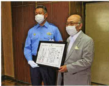
熱海地区の受賞状況