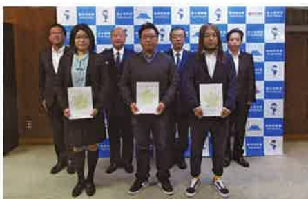
富士警察署長からの委嘱状を受ける

ネット犯罪」について、子ども達にとっては少々刺激的な言葉を盛り込みながら講話を行っています。