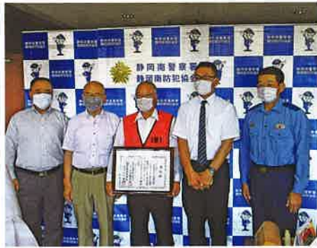
静岡南地区の受賞状況