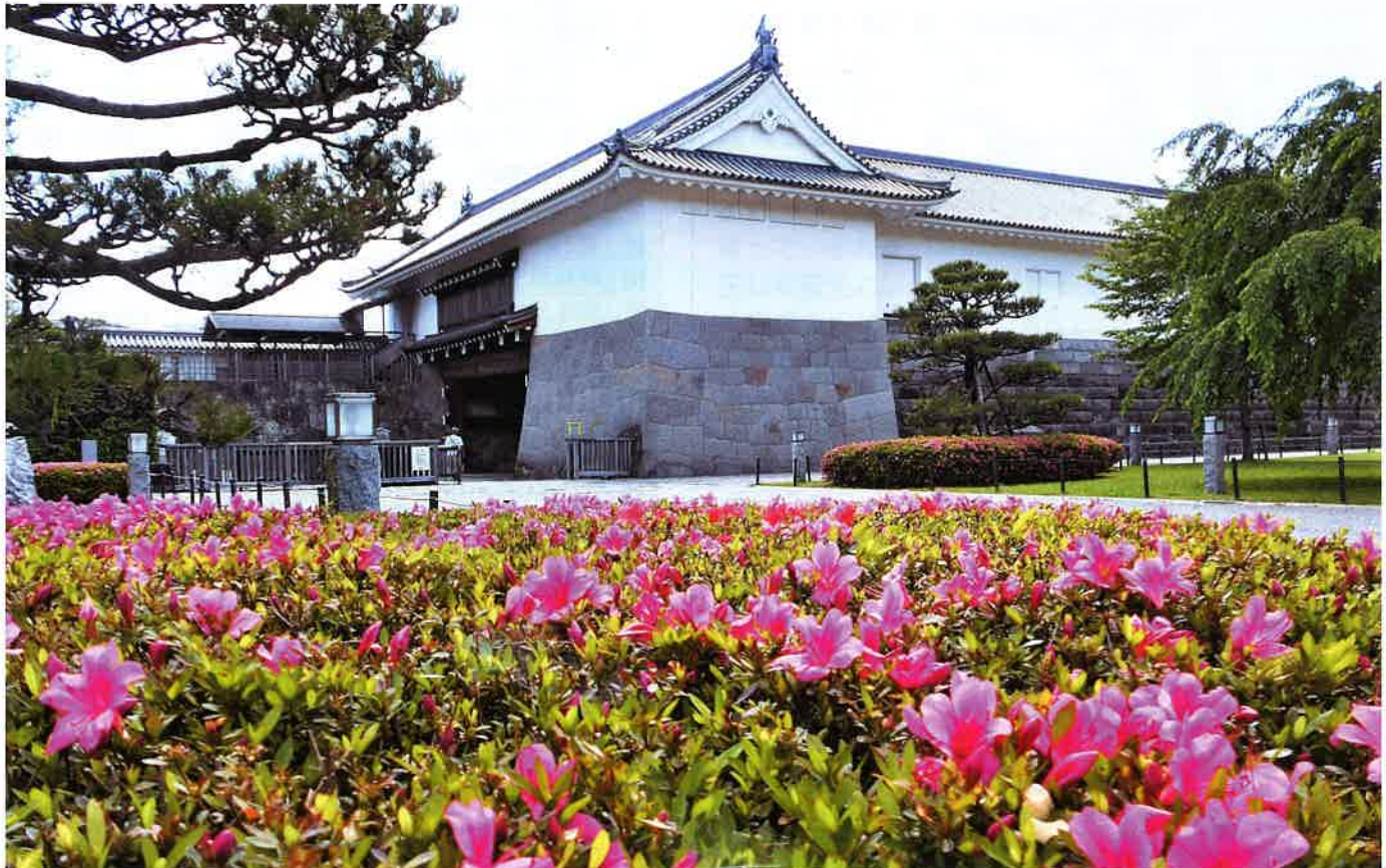
駿府城公園の巽櫓

発行・編集 (公社)静岡県防犯協会連合会 (静岡県風俗環境浄化協会) 〒420-0839 静岡市葵区鷹匠二丁目5番7号 交通会館ビル4階 TEL (054) 254-3750 FAX (054) 273-6820 ホームページ http://www.shizuoka-bohan.or.jp/