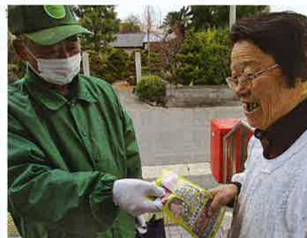
「本当に、お年寄りのお金を狙うなんて怖いね〜」

浜北の地域安全推進員の皆さんは地元の方々のお知り合いも多いうえに信頼が厚く、活動時写真の撮影許可をいただく際に快く応じていただけます。この笑顔を守るため、みどりの街をオールグリーンにするべく地域安全活動を続けていきます。