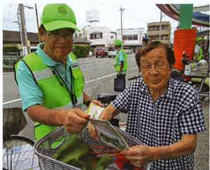
特殊詐欺被害防止広報チラシを配布する地域安全推進員

そんな浜北区では今日も地域安全推進員63名がシンボルカラーの緑色の帽子とジャンパーを身にまとい、コロナ禍を乗り越え登校する子どもたちを見守