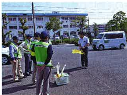
ホイッスル付き見守り旗の配布

しかし、今年に入ってコロナが流行し、これまでの常識や習慣が一変させられました。人々が集まり、顔を合わせて人と人とのつながりを重視してきた地域防犯活動とは相反します。三密を避け、人との距離が求められるため、イベントやキャンペー