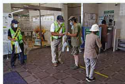
振り込め詐欺被害の目撃キャンペーン