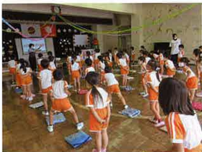
3密防止の中での防犯教室の実施状況

特殊詐欺の被害が増えた背景には、新型コロナウイルス感染を恐れた高齢者の在宅時間が増え、詐欺電話に対応してしまう機会が増えたことなどが考えられま