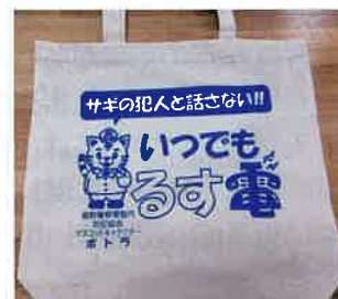
レジ袋有料化に伴い配布した防犯エコバッグ

with コロナ時代の到来で、地元で生活し、犯罪に対するアンテナを持つ地域安全推進員の存在がますます重要になっていきます。みなさんのお力も借りながら、安全安心なまちづくりに貢献したいと考えています。