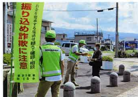
詐欺被害防止キャンペーン