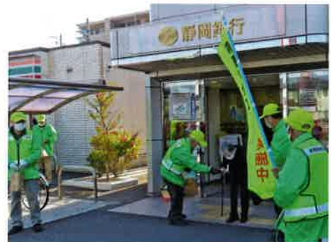
サギ電話には気を付けないでね

コロナ禍において特殊詐欺の手口も日々巧妙に進化し続ける中で、特殊詐欺は、決して他人事ではなく身近な出来事であることを一人一人に周知してもらえよう、皆様のお力をお借りしながら“継続的防犯活動”を今後も引き続き頑張ります。