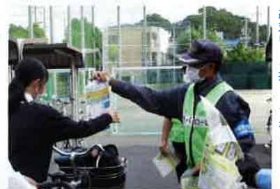
絶対にカギ掛けてね!

や金融機関での啓蒙活動、高校での自転車盗難防止指導、小学1年生を対象にした防犯教室の開催、地域のまつりでの防犯活動、警察、静岡市主催の防犯活動に参加しています。