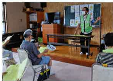
サギ電話にだまされないで