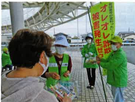
特殊詐欺は、他人事じゃないでね

人生の大先輩の、方言を交えながらの親しみのあるやさしい声掛けから学ばせてもらうことも多く、防犯講話の際は、大先輩方を真似た間の取り方や言い直しなどを取り入れることで、聞く手側も親近感を持ってくれ、私自身、日々勉強の毎日で仕事の多い仕事