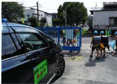
気をつけて帰るんだよ!