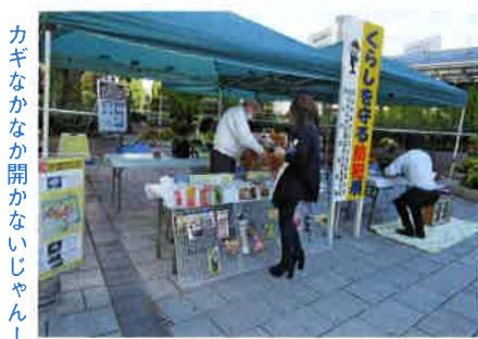
カギなかなか開かないじゃん！