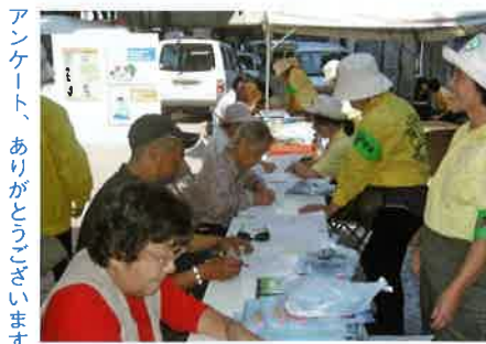
アンケート、ありがとうございます

「暮らしを守る防犯展」、小さな活動ではありますが、女性部の真摯な地域安全活動により、自主防犯意識が一層市民に浸透し、「安全・安心の街浜松」が実現することを願って活動を続けていきます。