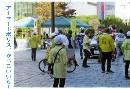
アーマードポリス、カッコいい！