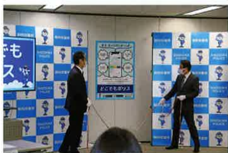
アプリ名発表の除幕式

静岡県警察は、特殊詐欺対策、子供・女性の安全対策に効果的な防犯情報発信等を目的として、スマートフォン用アプリケーション「どこでもポリス」を開発し、2月1日（水）県庁別館において完成記念式典を開催しました。当連合会としては、警察本部と連携して新たな防犯情報発信ツール「どこでもポリス」の県民への普及を図るため、広報用ポスター、チラシを作成しました。