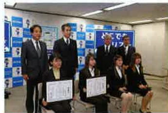
協力者表彰の状況

記念式典において、「どこでもポリス」の機能説明のほか、同アプリ広報活動等の協力者に対する表彰を行いました。