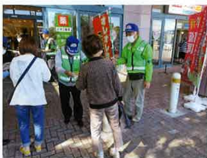
清水区狙われてます！気をつけて！

昨年10月、子どもを狙った不審者情報があった際には、すぐに対応していただき、「気をつけて帰ってね」の声かけに、「ありがとう！さようなら！」と子ども達の声が通学路に響きました。