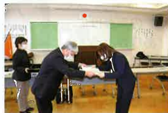
永年勤続表彰の状況

また、地区防犯協会長期勤務者の伊東地区、浜北地区の防犯指導員2名に対し、永年勤続表彰を行いました。