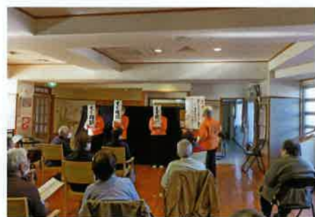
騙されないように覚えて下さい！

推進員の中には高齢の方もいますが、全員がお元気で、笑顔で活動しており、私も推進員の皆様に負けないよう皆様が笑顔で暮らしていけますように努めてまいります。