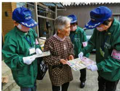
「おしえ隊」の高齢者宅への戸別訪問

私としては、高齢化が進んでいる推進員さんの健康を第一に願っており、今後も皆様が無理なく、気長に、楽しく活動を進めていただけるように支えていきたいと思っております。