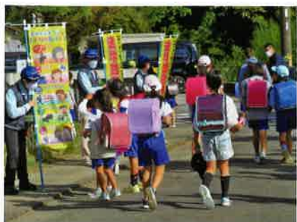
「いってきます。いつもありがとう！」

特殊サギ被害防止対策は、8地区（4交番、4駐在所）の推進員が、毎月15日に各地域の金融機関やコンビニ等の店舗利用客を対象に、