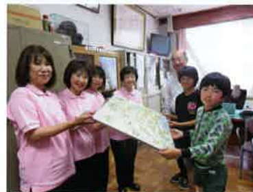
身近な犯罪マップ贈呈式

以上のように、できる範囲で無理なく活動することが、長く続けられるポイントだとの思いで、取り組み続けていただいております。