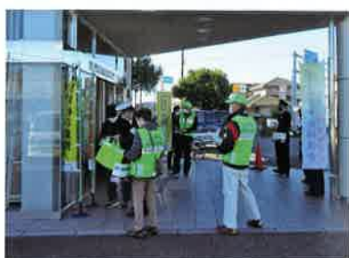
金融機関にて特殊詐欺被害防止キャンペーン