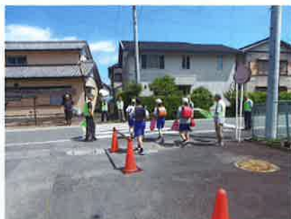
子どもたちの見守り

には子供達から感謝の寄せ書きをいただき、大変うれしく思いますし、これからも頑張って子供達を見守ってほしいという気持ちが増します。朝の「おはようございます。」「行ってきます。」の大きな声のあいさつからは元気と力をもらい、この9年間何事もなく活動できたことに感謝しています。