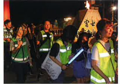
御神火まつりパトロール