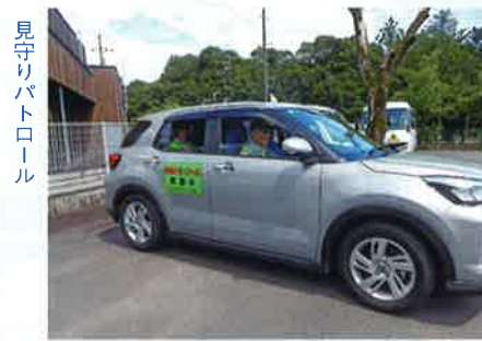
見守りパトロール

これからも「東山口っていいなあ」のスローガンのように安全で安心してらせる地区にしたいと皆でがんばってほしいと思います。